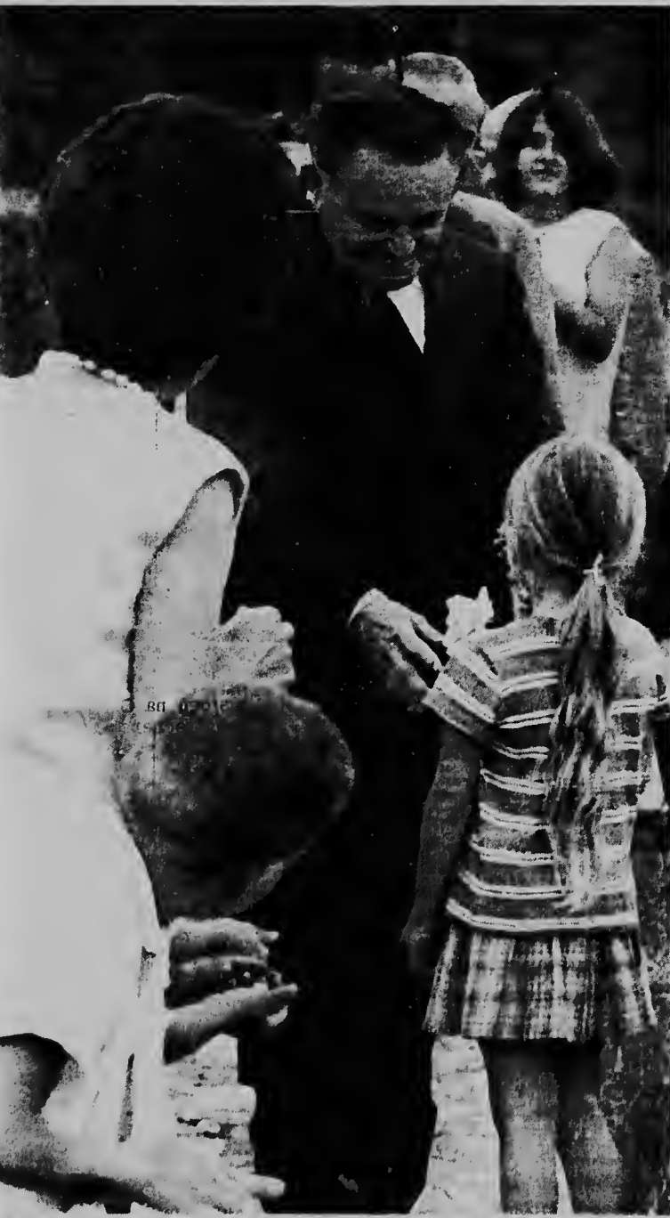
Recientemente e ciudad Cacarias na Brasil a sufrí efectonan serio di inundacionnan cu tabata consecuencia di awacerrunan torrencial cu cal den e region aki. Presidente Castello Branco a bishita e ciudad a hanja e recepcion aki di un hoben admiradora.